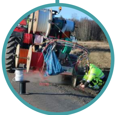
På bilden använder vi en tekniken microtrenching, vilket är ett skonsamt men effektivt sätt att bygga ut fibernätet på.